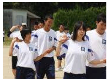
フォークダンス(3年)